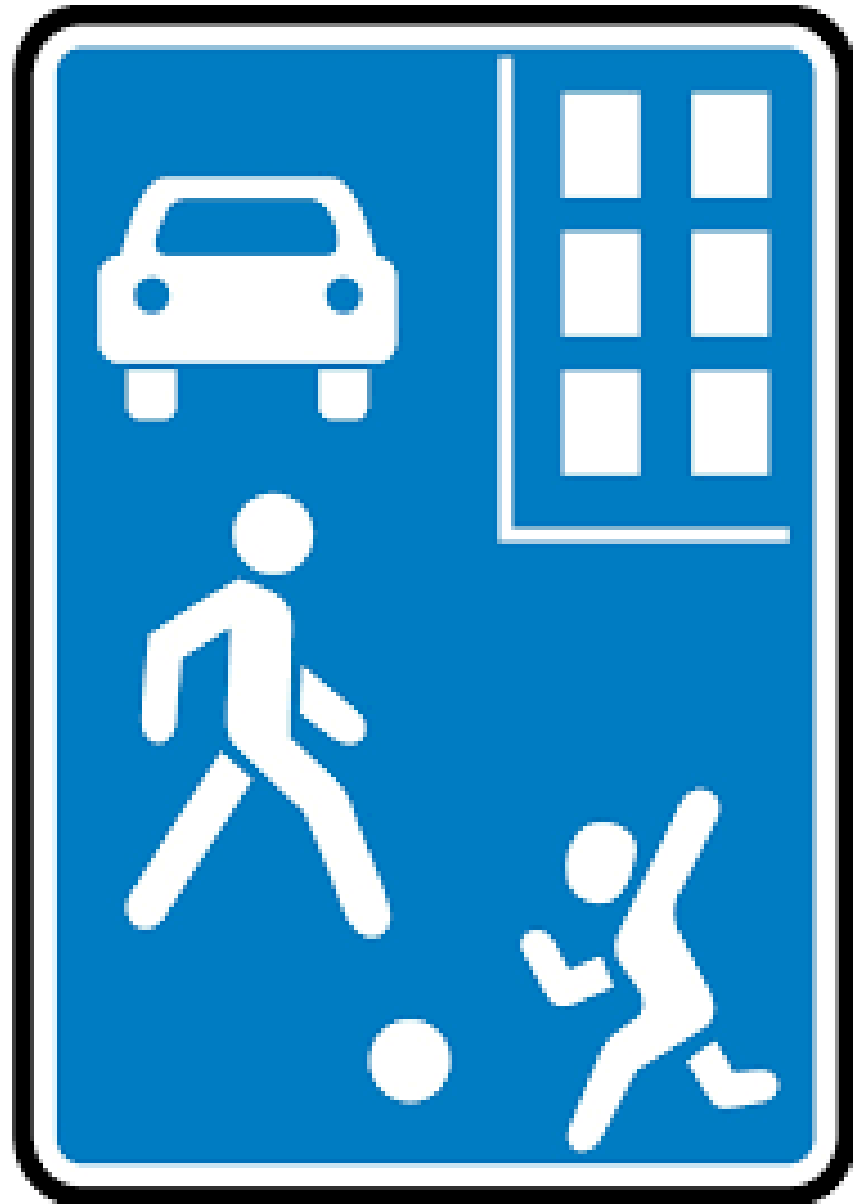
Дорожный знак «Жилая зона»