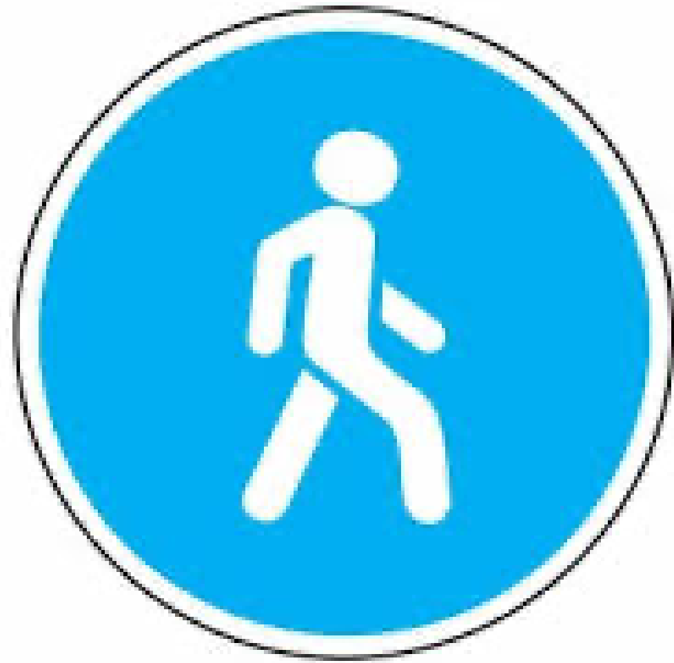
Дорожный знак «Пешеходная дорожка»