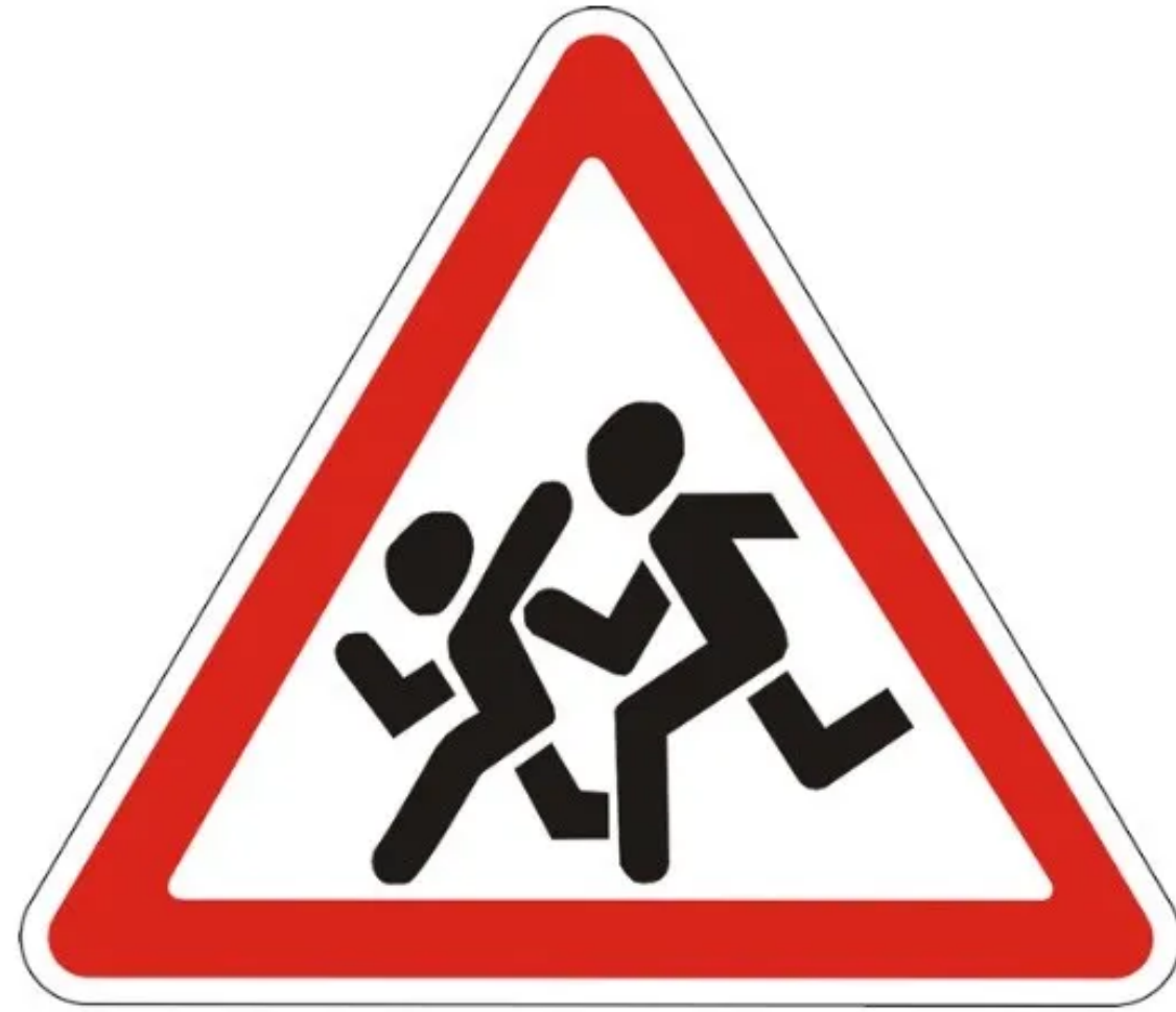
Дорожный знак «Дети»