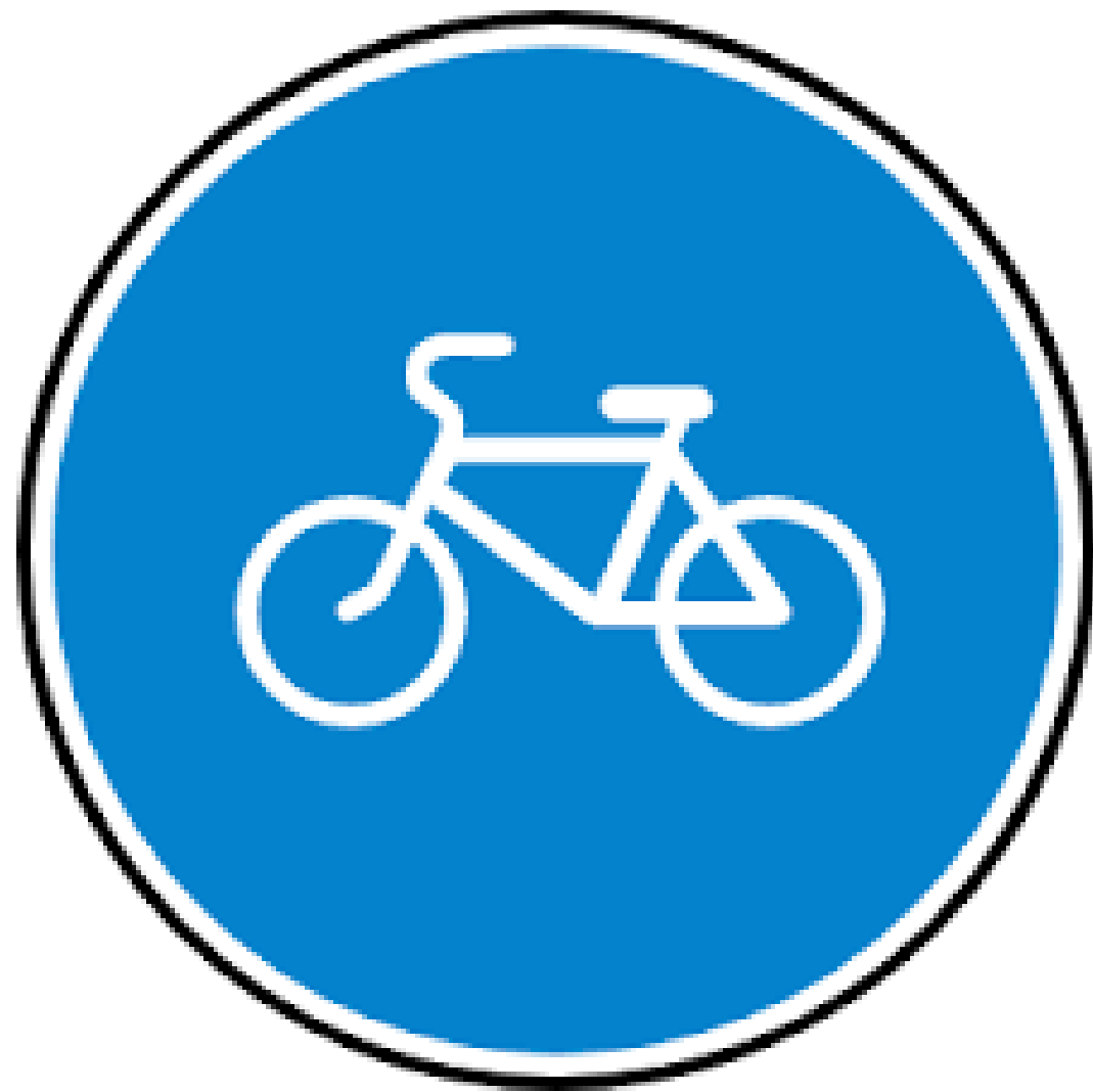
Дорожный знак «Велосипедная дорожка»