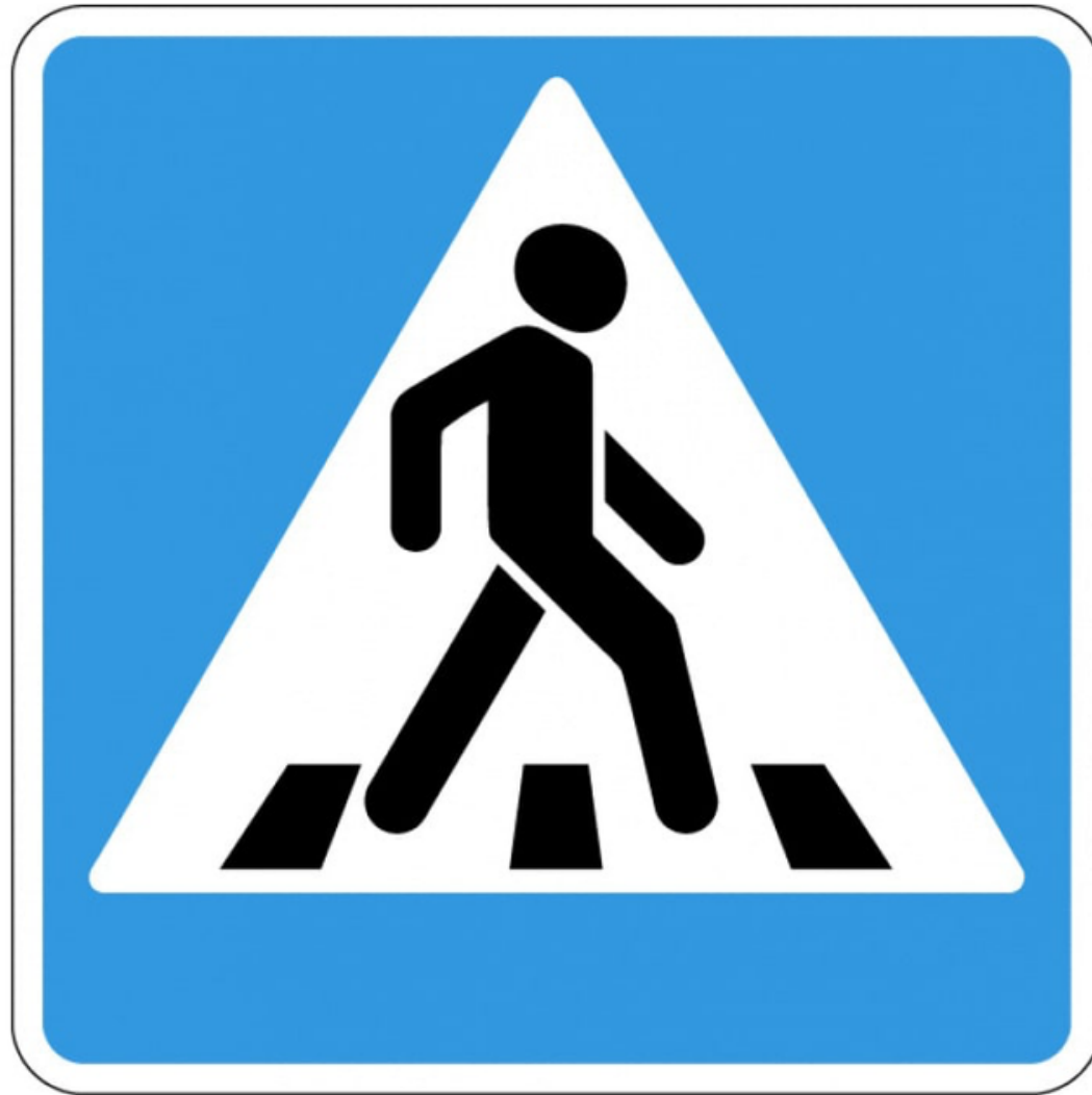
Дорожный знак «Пешеходный переход»