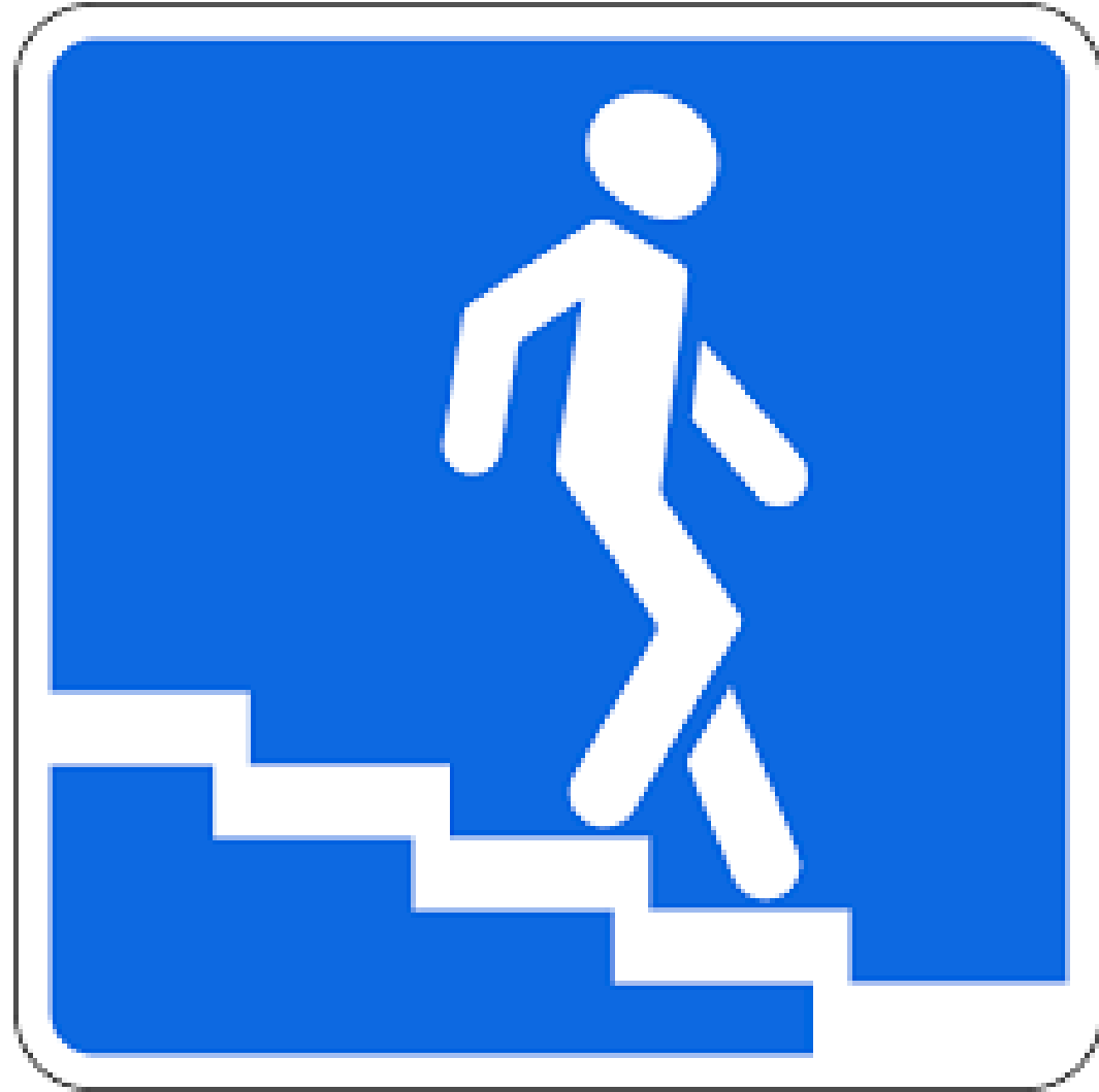
Дорожный знак «Подземный пешеходный переход»