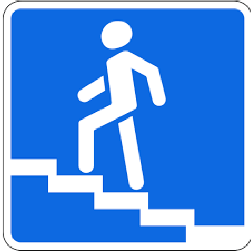
Дорожный знак «Надземный пешеходный переход»