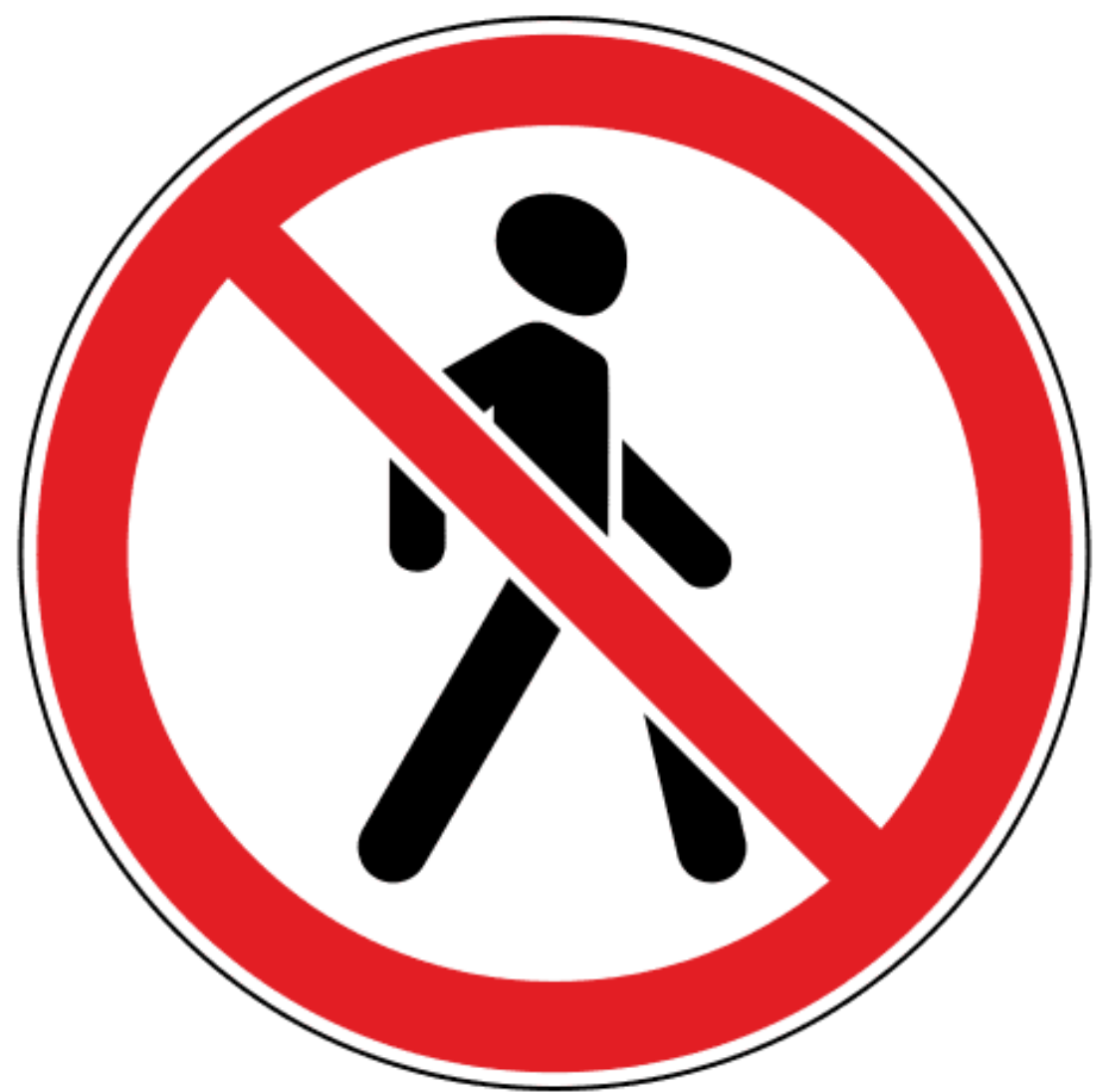
Дорожный знак «Движение пешеходов запрещено»